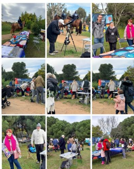
2 Février 2025