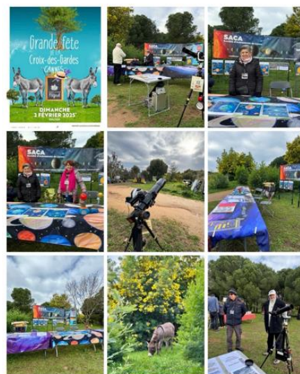
2 Février 2025