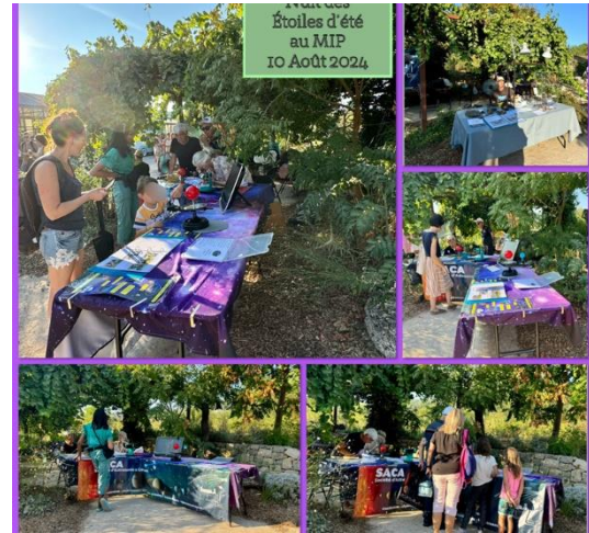
Mosaïque de photos réalisée par Geneviève GAZAN Toutes les photos sur notre site : saca06.fr